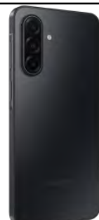
Samsung Galaxy A17 128GB 60.33 EUR