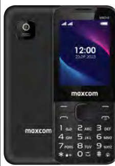
Maxcom MM 248 4G 0 EUR