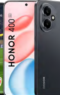
HONOR 400 5G 8GB 256GB 0 EUR