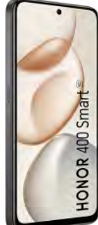
Honor 400 SMART 128GB 50.41 EUR