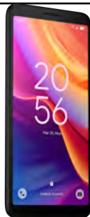
TCL 501 PRIME DUAL S 9.09 EUR

Pentru telefoanele premium (ex. Samsung S Iphone) este necesara precomanda la Orange, ulterior se primeste confirmarea de rezervare/cod rezervare si termenul estimat de livrare