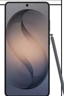
Samsung S26 Ultra 5G 512GB 61.16 EUR