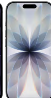
Apple iPhone 17 512 GB 0 EUR