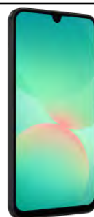
Samsung A26 128GB 0 EUR