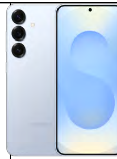
Samsung S25 128 GB 29.75 EUR