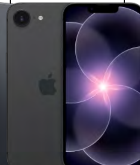
Apple iPhone 17e 256GB 0 EUR