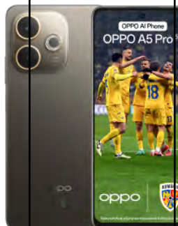
Oppo A5 PRO 256GB 0 EUR