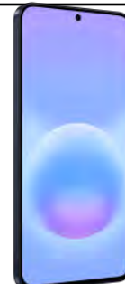
Samsung A57 128 GB 0 EUR